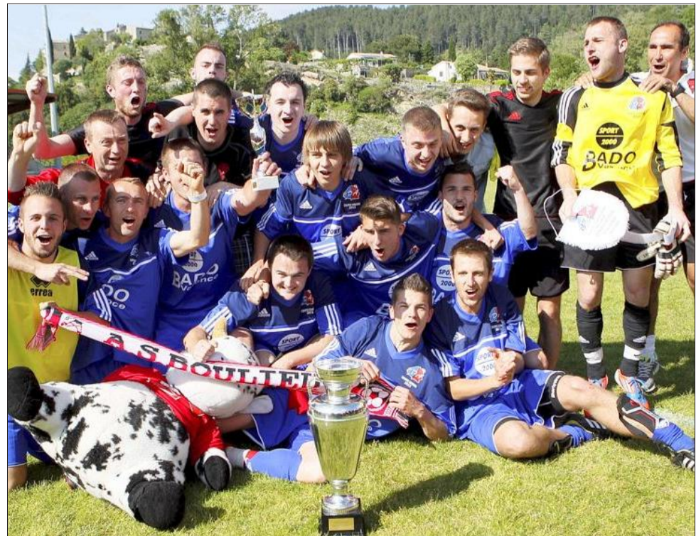
HEUREUX. Les Bonloculiens succèdent à Bourg-lès-Valence au palmarès de la coupe Giraud.

Dominer n'est pas gagner et hier les Drômois de Crest-Aouste l'ont appris à leur dépend en s'inclinant face à leur adversaire du jour, l'ES Boulieu-lès-Annonay. Pourtant le club drômois a marqué ce match par une possession de