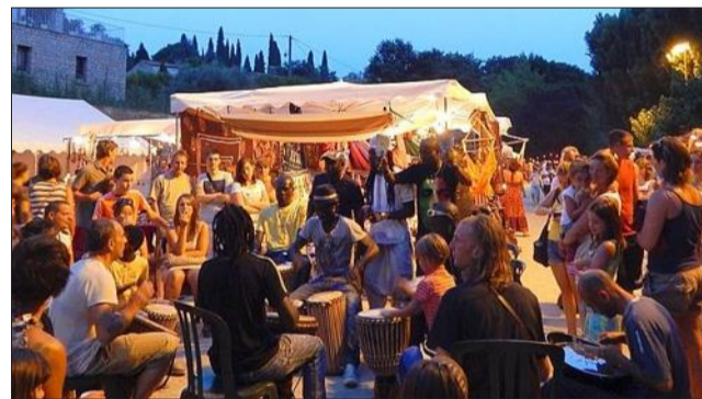
Beaucoup de monde autour des percussionnistes.

Après une après-midi caniculaire, la fraîcheur du début de soirée a permis à nombreux publics de profiter agréablement des animations gratuites proposées par l'association Burkin'Amitiés sur la place de Poulallé.