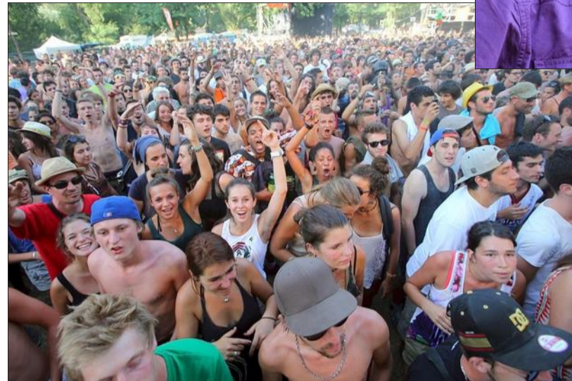
Près de 15 000 personnes hier pour voir John Holt (ci-dessus) Naâman, Jah Mason et Omar Perry (ci-dessous).