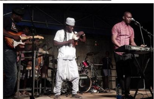
Aux rythmes de la musique africaine, le groupe Ngalam a fait danser le public. Même les tout-petits se sont initiés aux percussions.